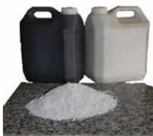
Granit SP White o Black

Proceso de fácil aplicación para la recuperación del brillo en granitos tanto blancos, rosas o negros. Para ello necesitaremos: