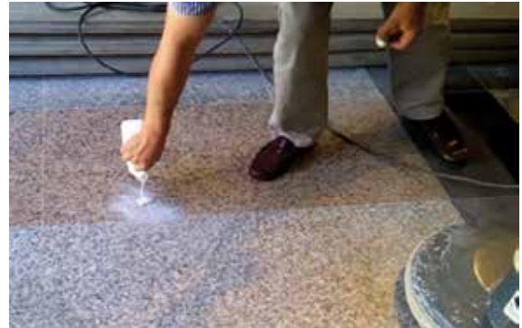
Mezclar Novagranit Spray con el anterior