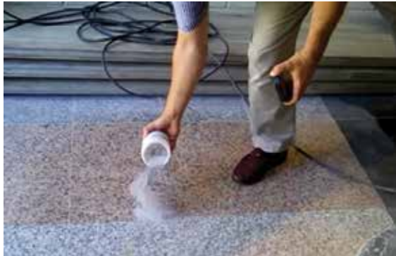
Verter Novagranit Polvo

Pulir la superficie decapada con una mezcla de Novagranit Spray y Novagranit Polvo utilizando el dico Inox: