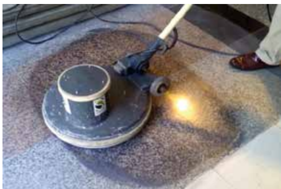
Empieza a subir el brillo