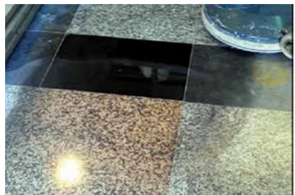
El resultado dependerá de la insistencia

Para el granito negro utilizaremos el mismo sistema pero con Novagranit Spray Black.