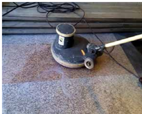
Decapar con disco negro de fregado negro