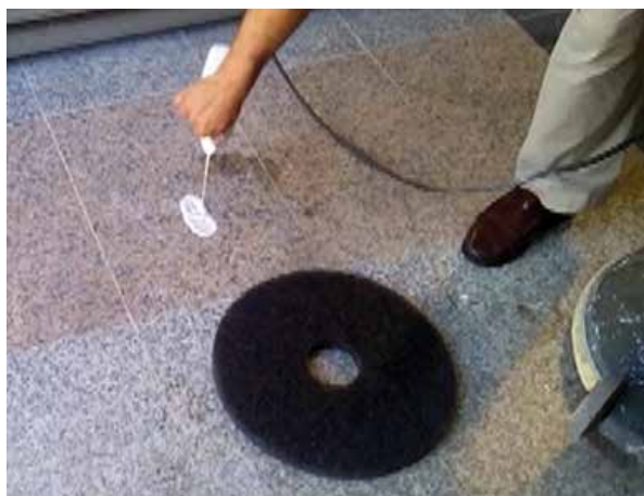
Verter Nova Granit Spray sobre la superficie a tratar

Limpiar y decapar la superficie de granito a tratar: