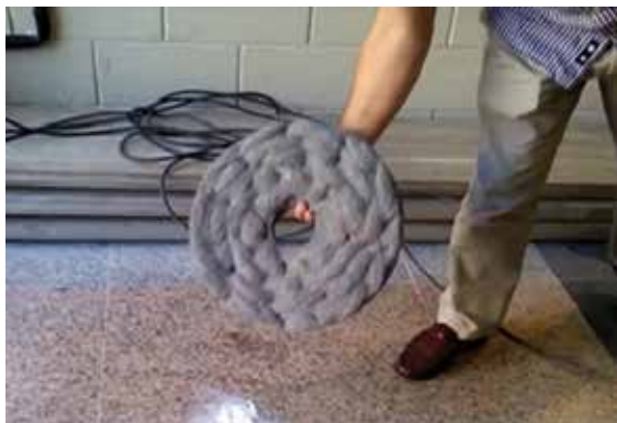
Utilizar el disco Inox