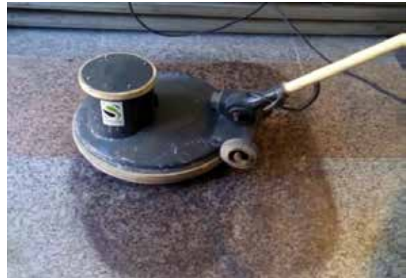
Pulir el granito con la mezcla realizada