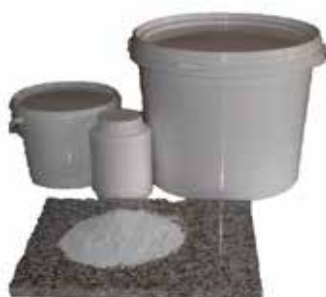
Nova Granit polvo